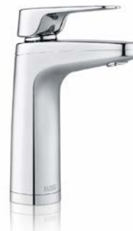
XL tappkran med tryckvred